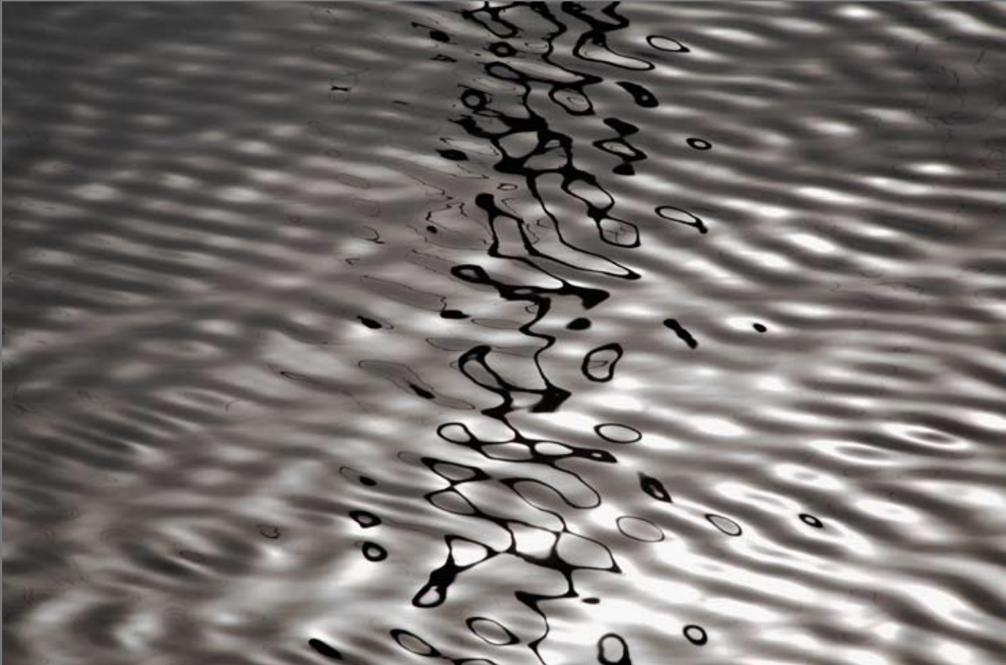
calligraphy lim. Auflage: 25 Stück, 30 x 45 ... 80 x 120