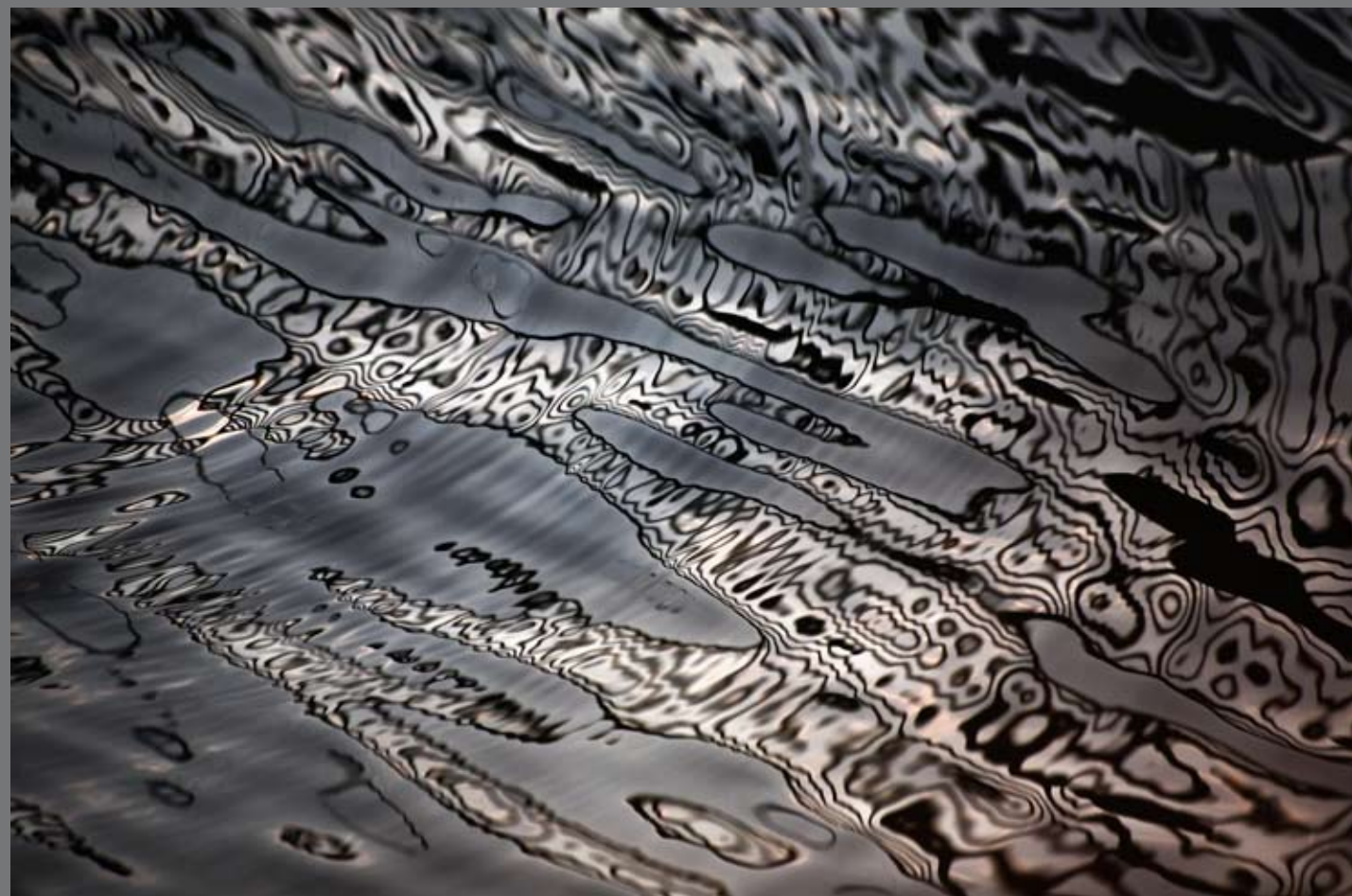
zebras in black lim. Auflage: 7 Stück (Original), 50 x 75 ... 100 x 150