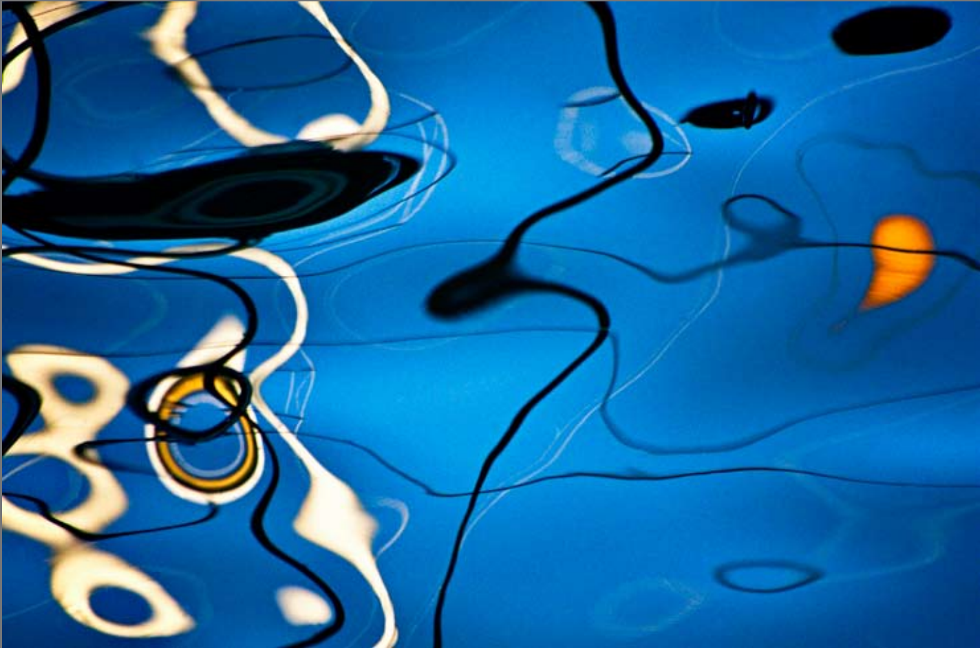
fliegende formen lim. Auflage: 25 Stück, 30 x 45 ... 50 x 75