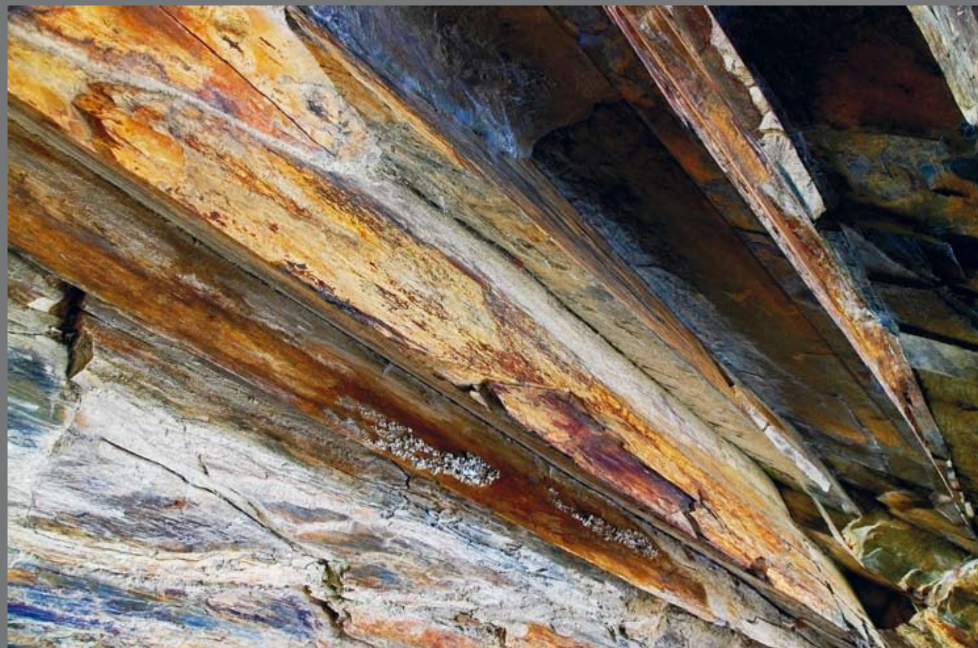
vertical dynamic lim. Auflage: 50 Stück, 50 x 75 ... 100 x 150