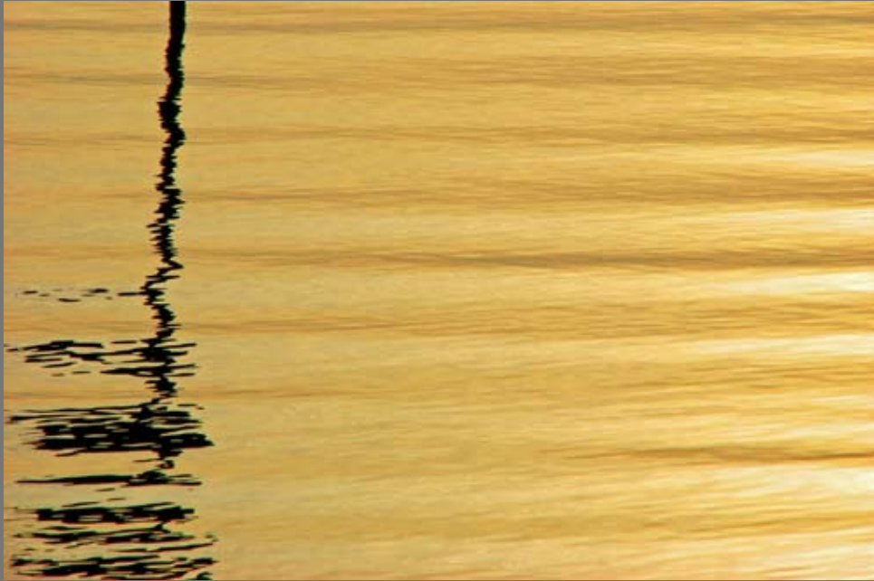
black gold lim. Auflage: 50 Stück, 20 x 30 ... 50 x 75