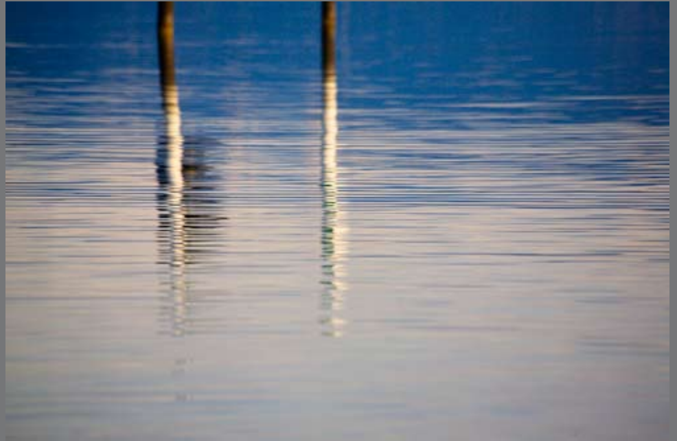
white illusion lim. Auflage: 7 Stück (Original), 50 x 75 ... 80 x 120