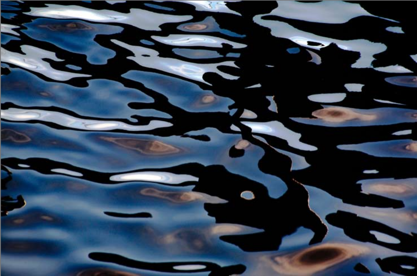
flowing abstraction lim. Auflage: 25 Stück, 30 x 45 ... 50 x 75