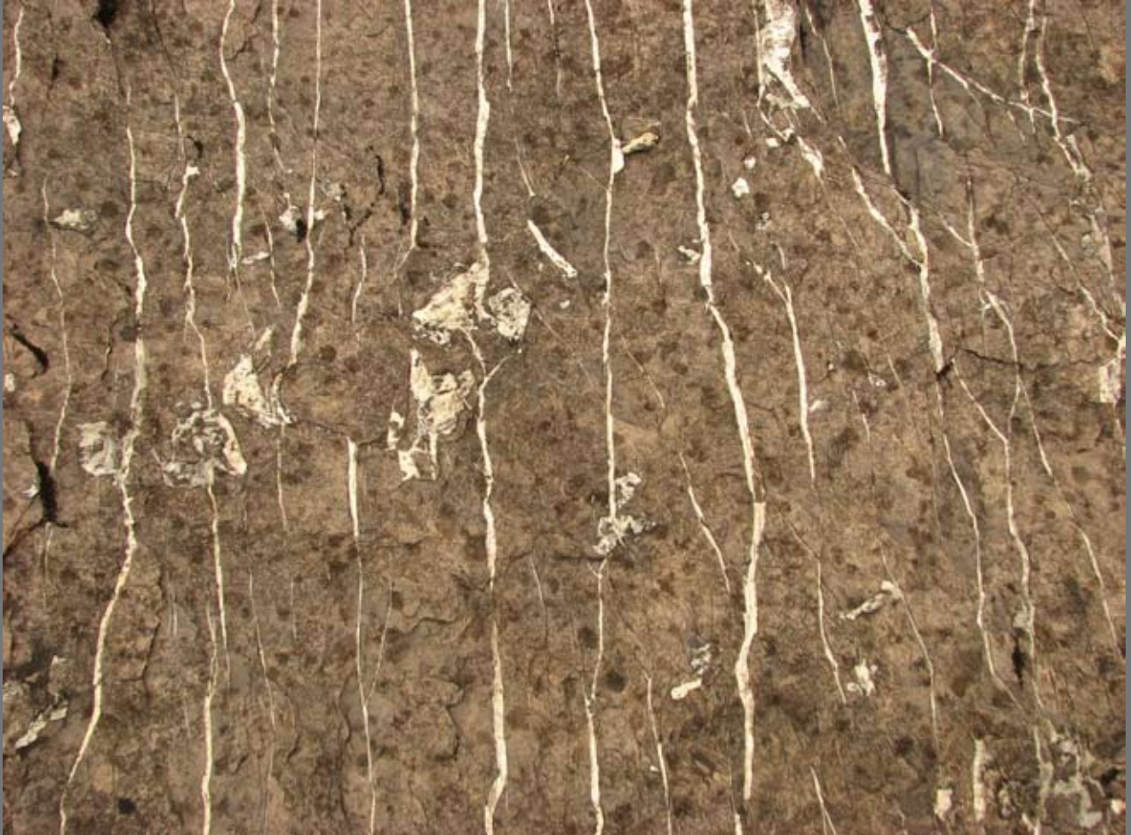
plants lim. Auflage: 7 Stück (Original), 40 x 60 ... 75 x 100