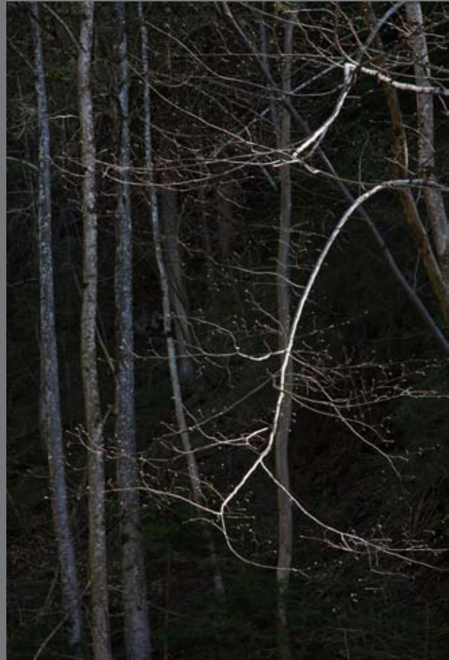
magic illumination lim. Auflage: 7 Stück (Original), 75 x 50 ... 150 x 100