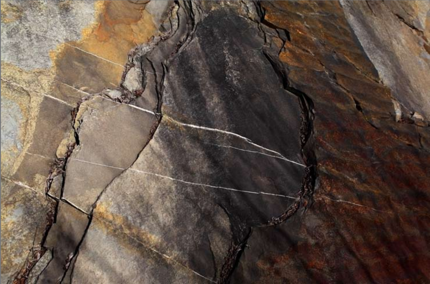
crossing lines lim. Auflage: 7 Stück (Original), 50 x 75 ... 100 x 150