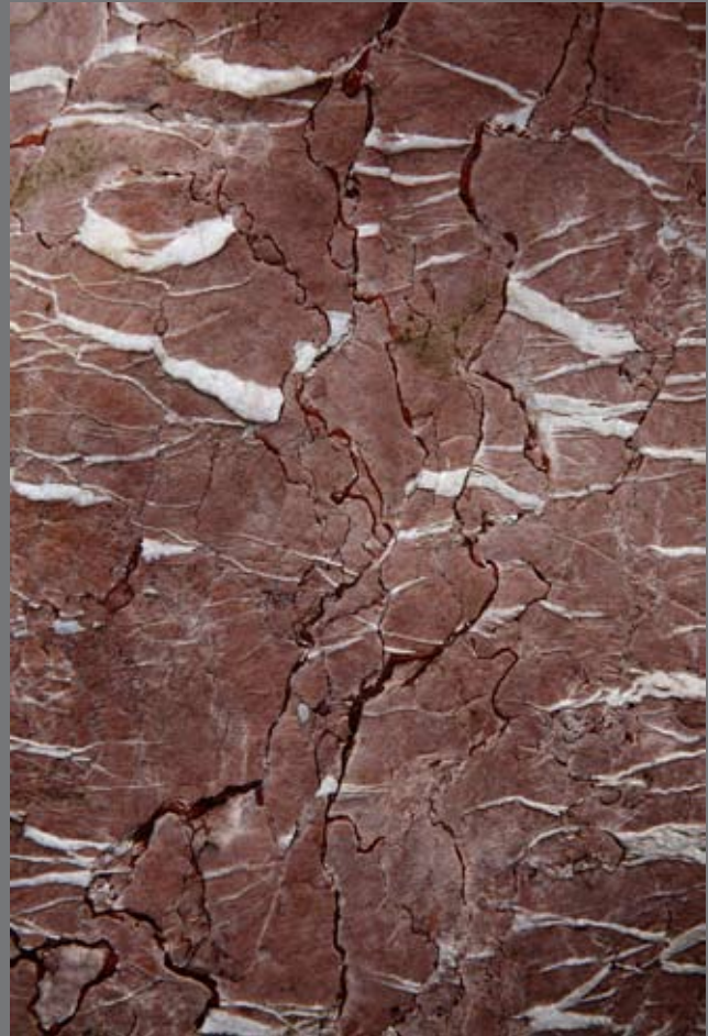
quarzbruch lim. Auflage: 25 Stück, 45 x 30 ... 150 x 100