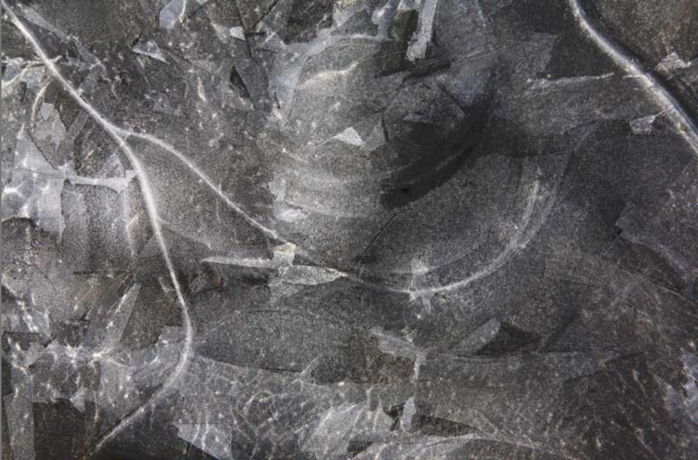
symbolische erleuchtung lim. Auflage: 7 Stück (Original), 50 x 75 ... 80 x 120