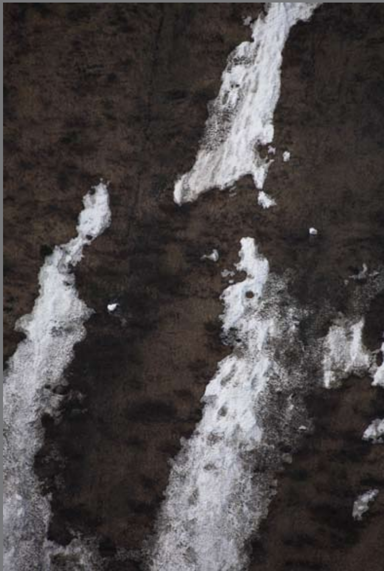
avalanche paintings I lim. Auflage: 7 Stück (Original) 45 x 30 ... 120 x 80