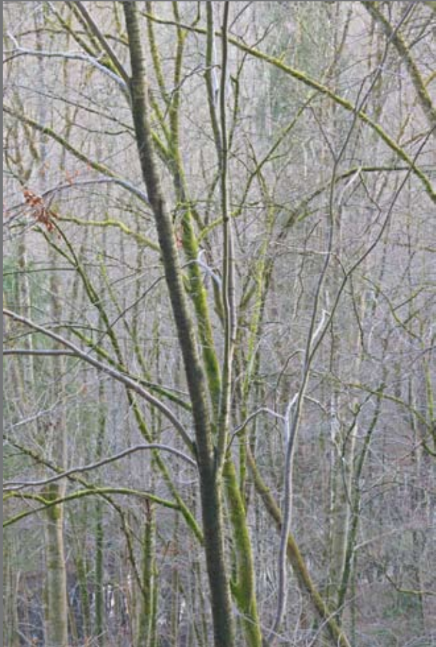
diversity lim. Auflage: 7 Stück (Original), 75 x 50 ... 120 x 80