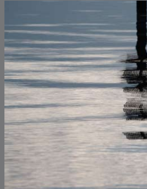
linear distortion lim. Auflage: 7 Stück (Original), 50 x 75 ...