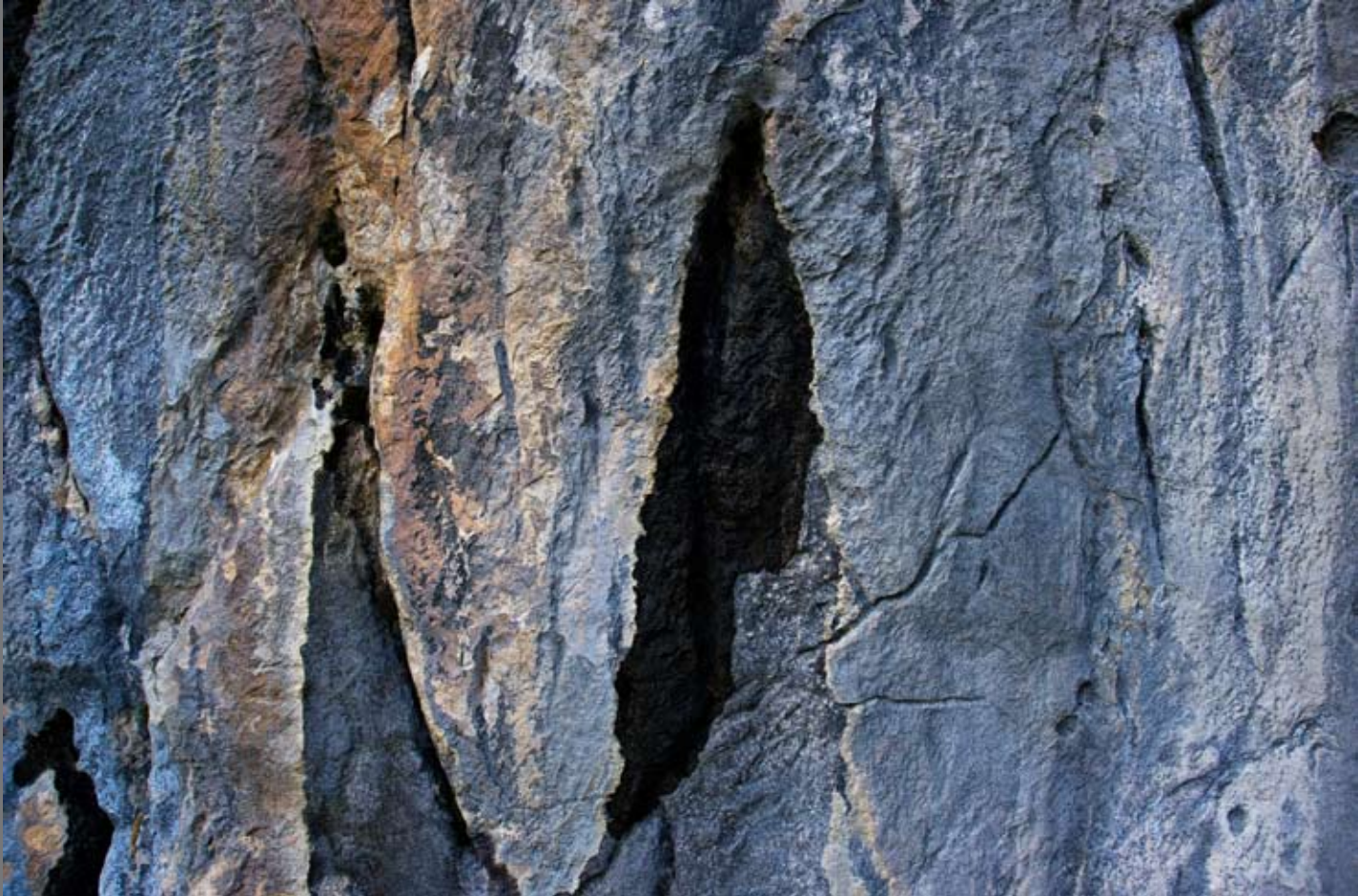
structure in colors lim. Auflage: 7 Stück (Original), 50 x 75 ... 100 x 150