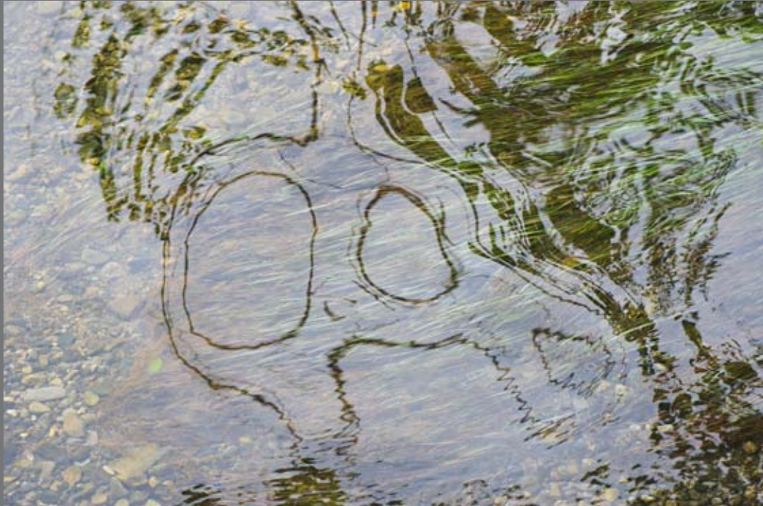
mirror face lim. Auflage: 7 Stück (Original), 50 x 75 ... 80 x 120