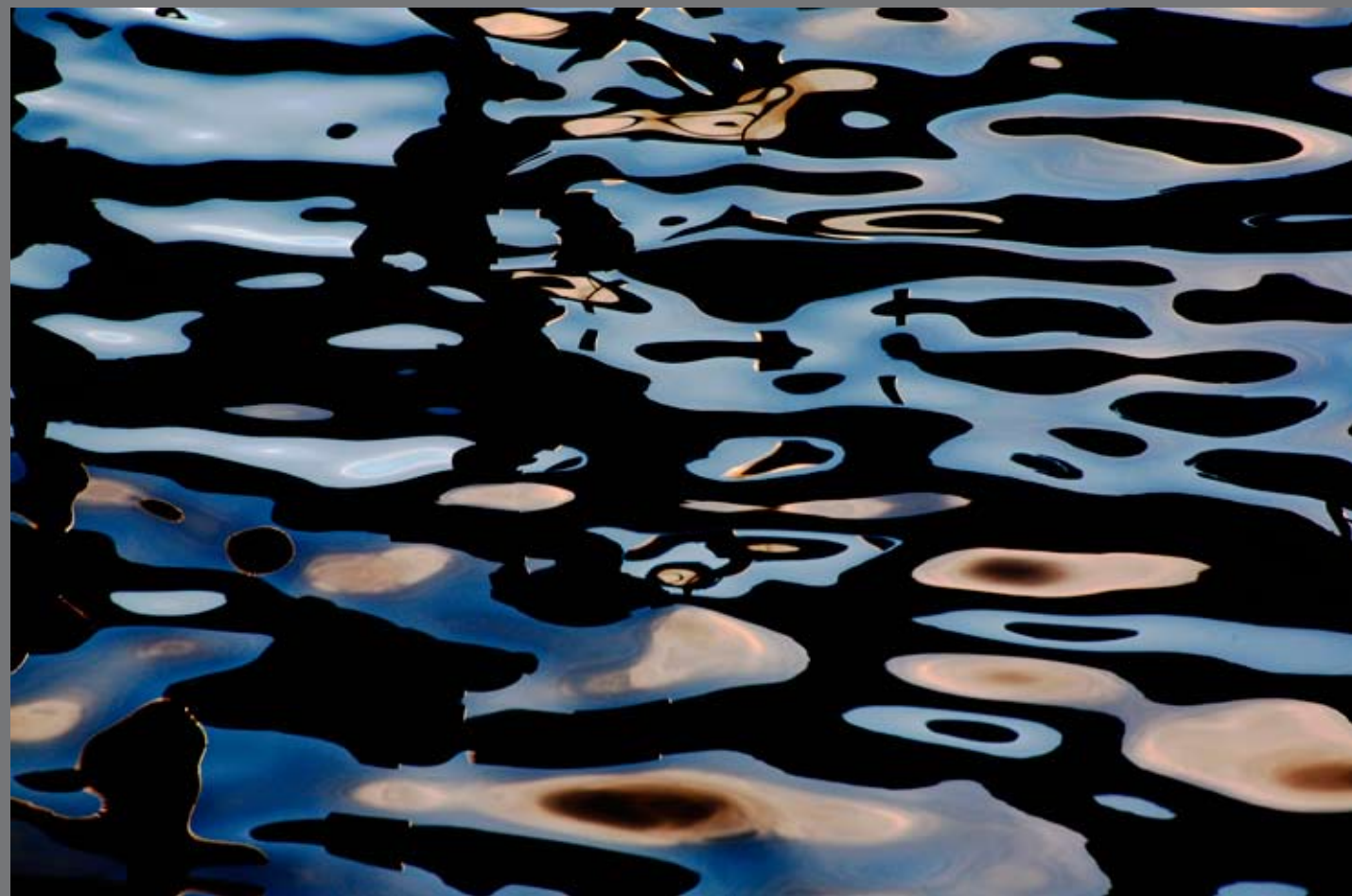
cruzified water lim. Auflage: 25 Stück, 30 x 45 ... 50 x 75