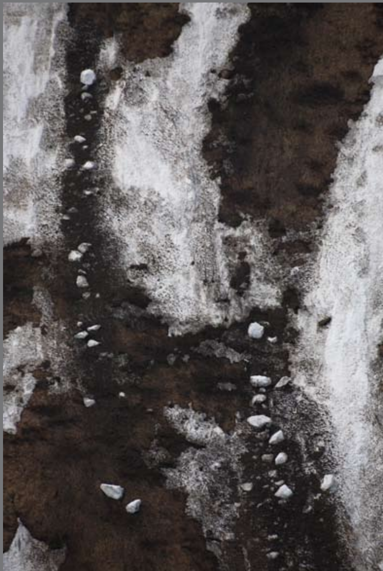
avalanche paintings II lim. Auflage: 7 Stück (Original) 45 x 30 ... 120 x 80