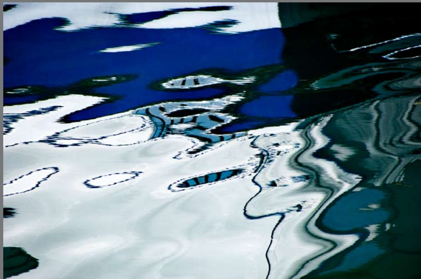
farbflächenwellen | lim. Auflage: 7 Stück (Original), 30 x 45 ... 60 x 90