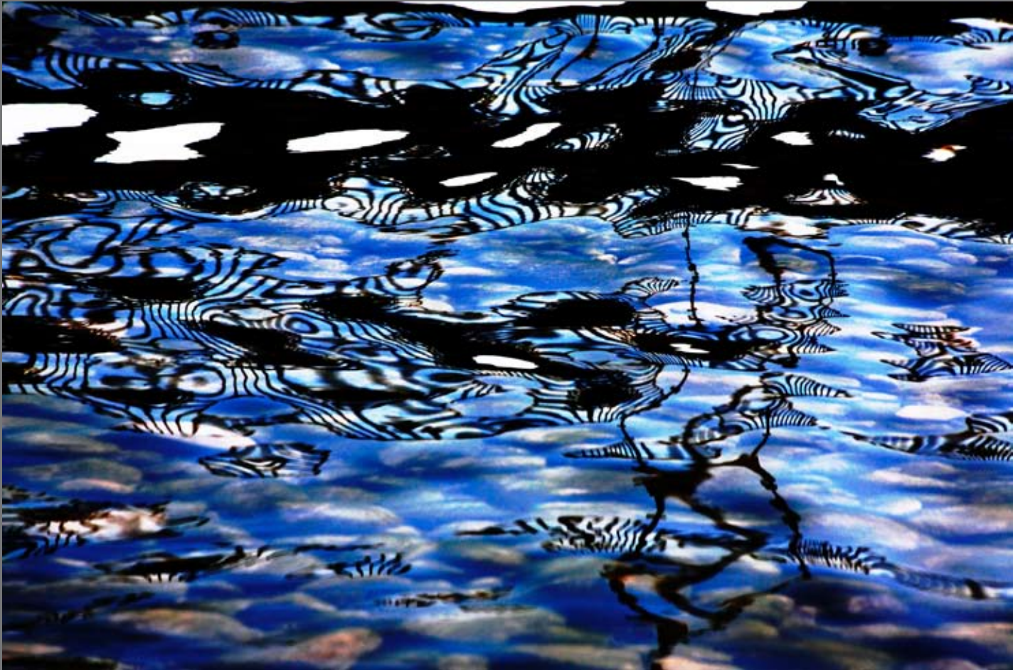
zebras in blue lim. Auflage: 7 Stück (Original), 50 x 75 ... 100 x 150