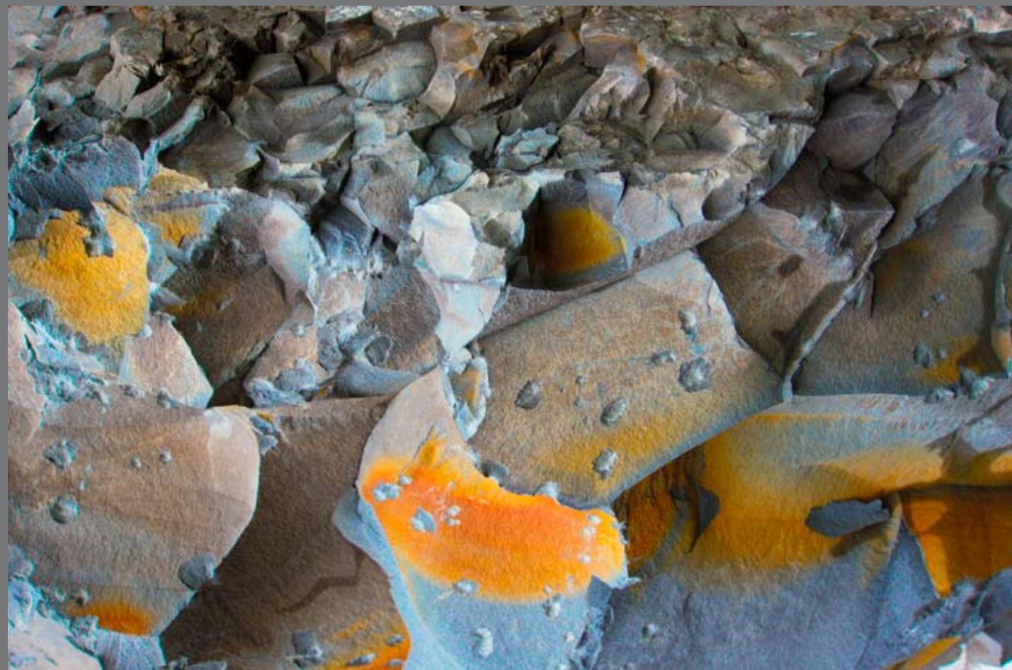
stonepainting lim. Auflage: 7 Stück (Original), 50 x 75 ... 100 x 150