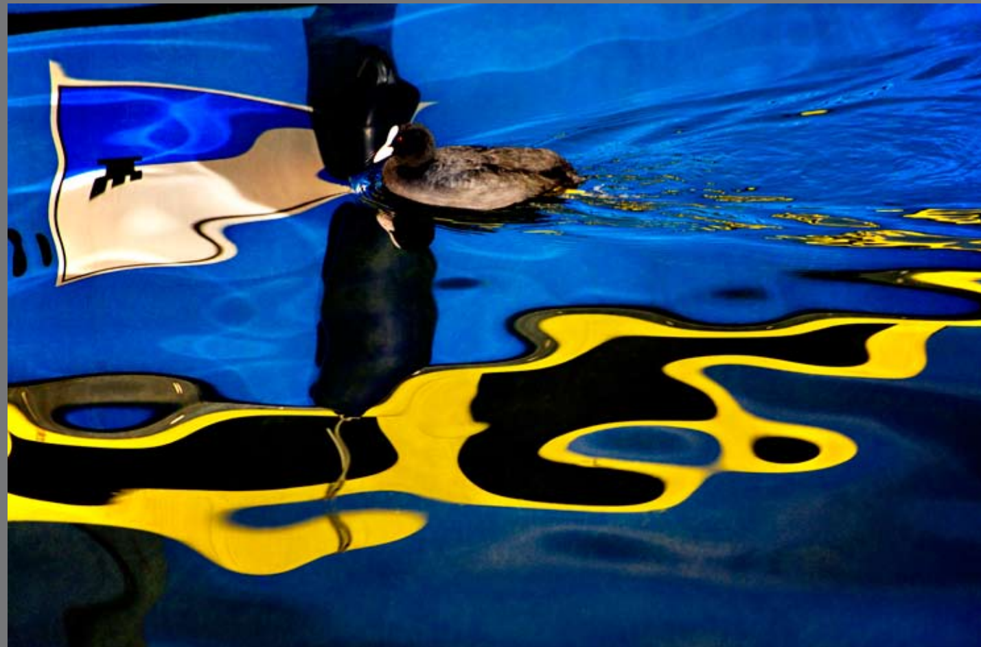
Fahnenflucht lim. Auflage: 25 Stück, 30 x 45 ... 50 x 75