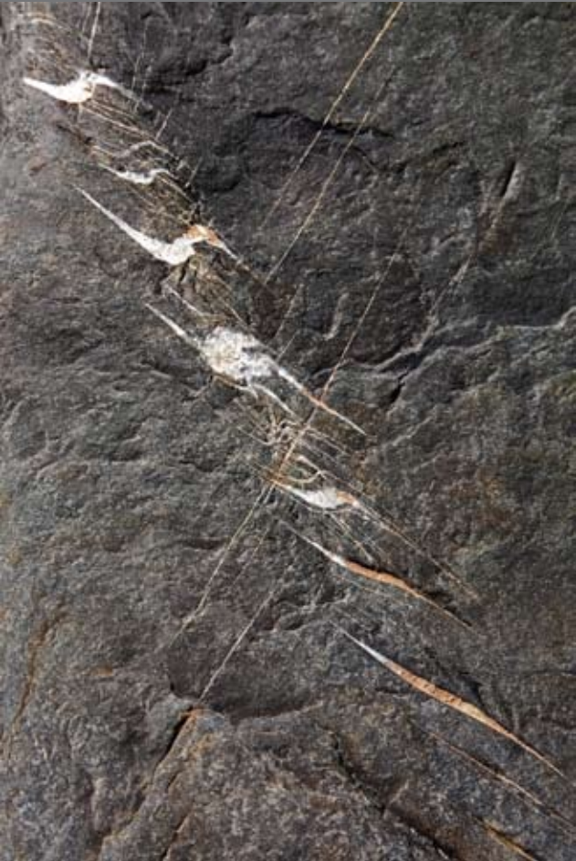
graphic inclusions lim. Auflage: 7 Stück (Original), 75 x 50 ... 120 x 80