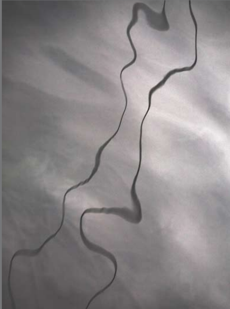
nude drawing lim. Auflage: 25 Stück 40 x 30 ... 75 x 100