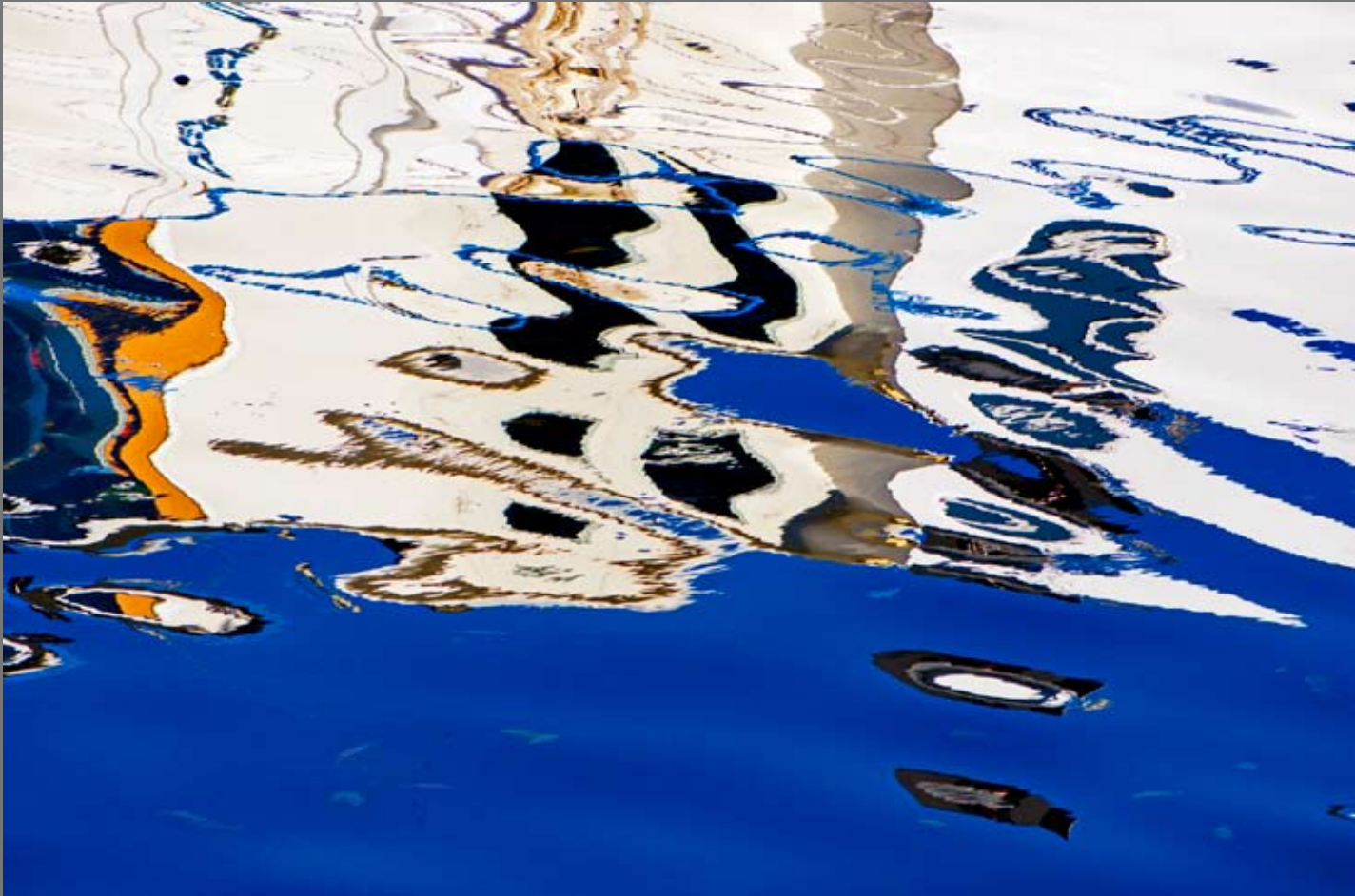
farbflächenwellen II lim. Auflage: 7 Stück (Original), 50 x 75 ... 100 x 150